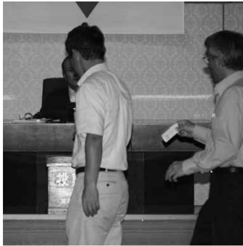
信念をもって投票に臨む（副議長選挙）

7月6日臨時会を開催し、正・副議長ほか、各常任委員会の所属など、議会の構成を決定しました。