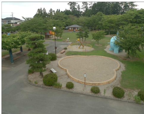
「八幡公園(遊具広場)」