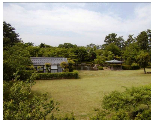
「八幡公園(庭園、茶室菁莪庵)」