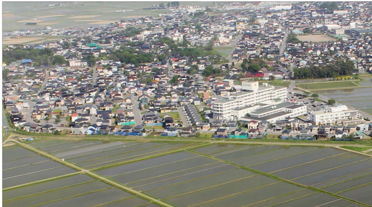
「松陽ニュータウン宅地開発」