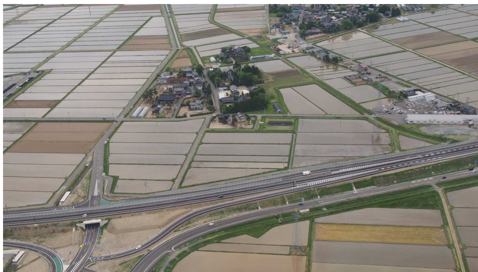
自動車専用道路「酒田余目線」