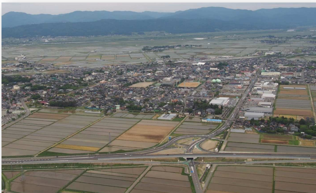
自動車専用道路「酒田余目線」余目 I C 付近