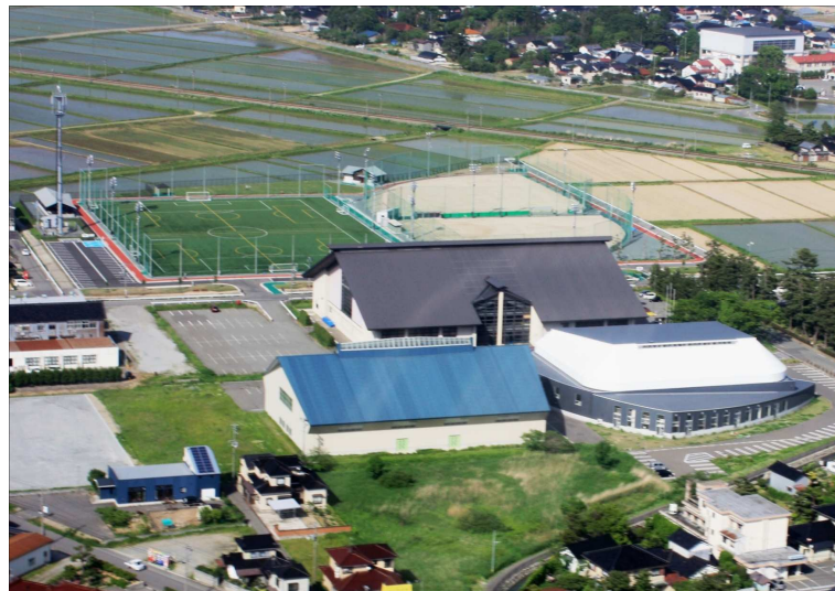
「八幡スポーツ公園開発」