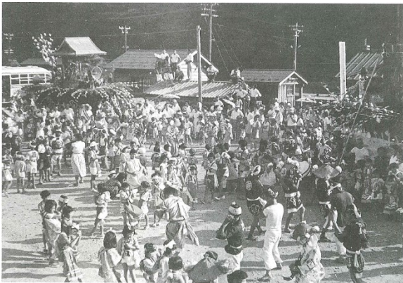
清川駅前広場に集まった山車 一九四四(昭和十九)年八月十八日

夏になると、最上川は子どもたちの格好の遊び場となりました。清川学校は最上川を公認の水遊び場とし、体を鍛える場としても活用していました。 毎年八月十八日には、御諸皇子神社例祭が盛大に行われ、みこしや山車、獅子踊りで、ますます賑わった清川地内。現在も夏になると、山車作りが行われ、八月十八日には子どもたちが山車を引いて歩きます。 冬は塞の神行事で、子どもたちはデグ様を持って唱言しながら、町内一軒一軒を回りました。