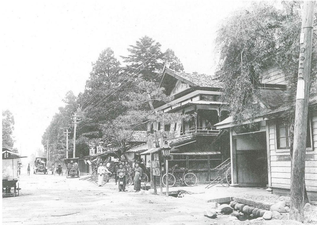
明治末期の清川本町通り