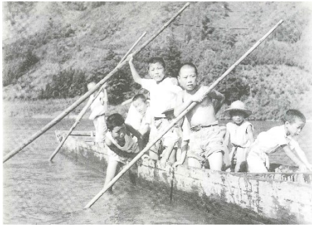
舟遊び 1952(昭和 27)年ごろ 子どもたちにとって、最上川は格好の遊び場でした