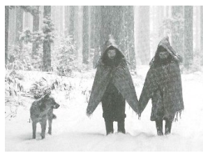
雪の御殿林を歩く ミノボウシ姿の子ども