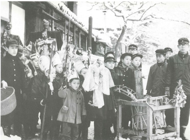
塞の神行事の神宿を出るところ 1960(昭和 35)年ごろ