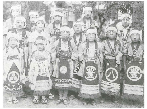
山車をひいた子どもたち 1935(昭和 10)年 8 月 18 日