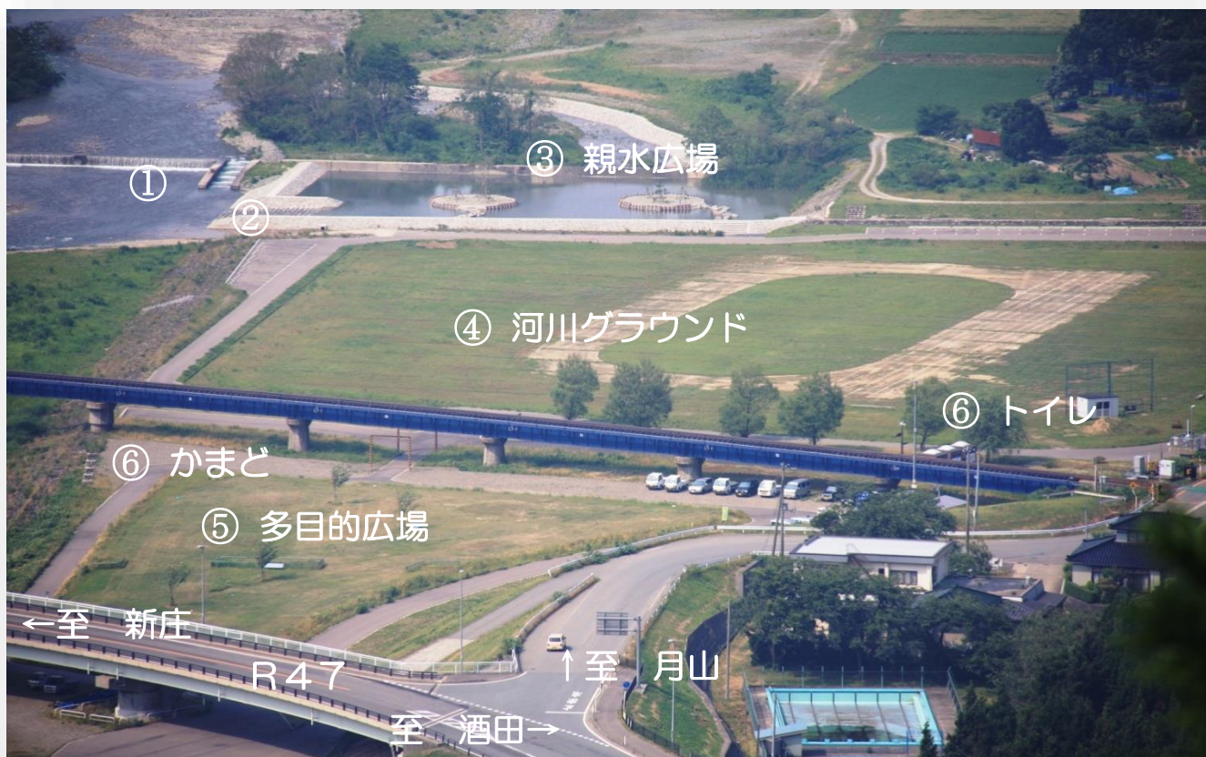
清川河川公園全景

ここでは、清川地区の住民が主体となり設立した「清川水辺の楽校」を中心に、様々な活動を行い、清川河川公園は、イベントや地域のいこいの場としてさらには町外からの来訪者に広く利用されています。