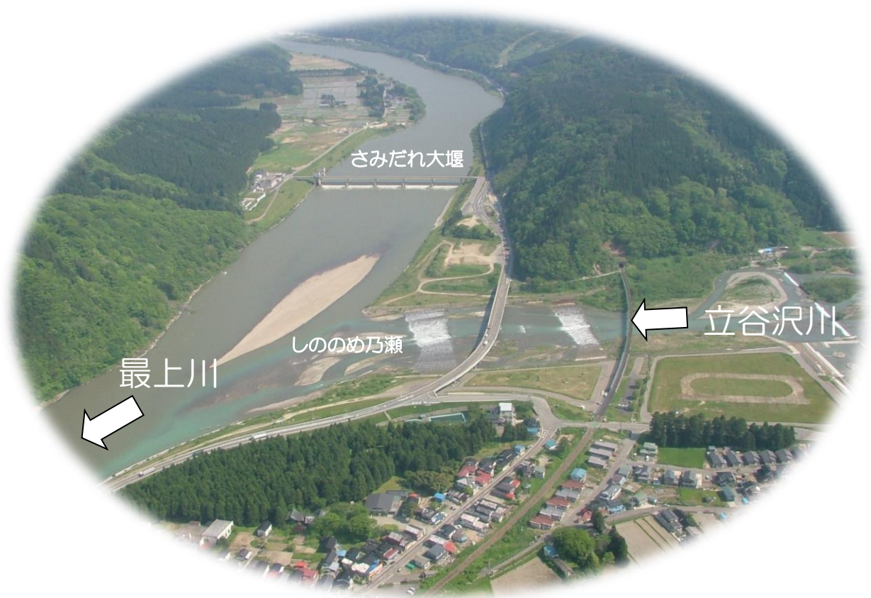
最上川・立谷沢川合流点と清川地区