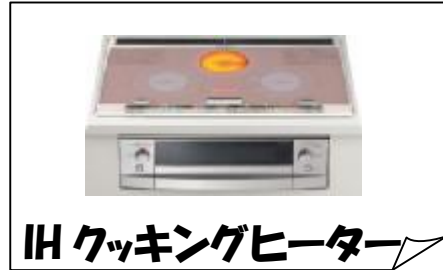
IH クッキングヒーター