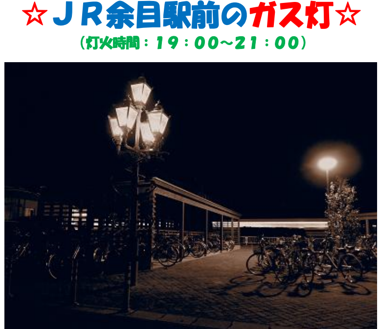
駅に向かって右側（セピア調）