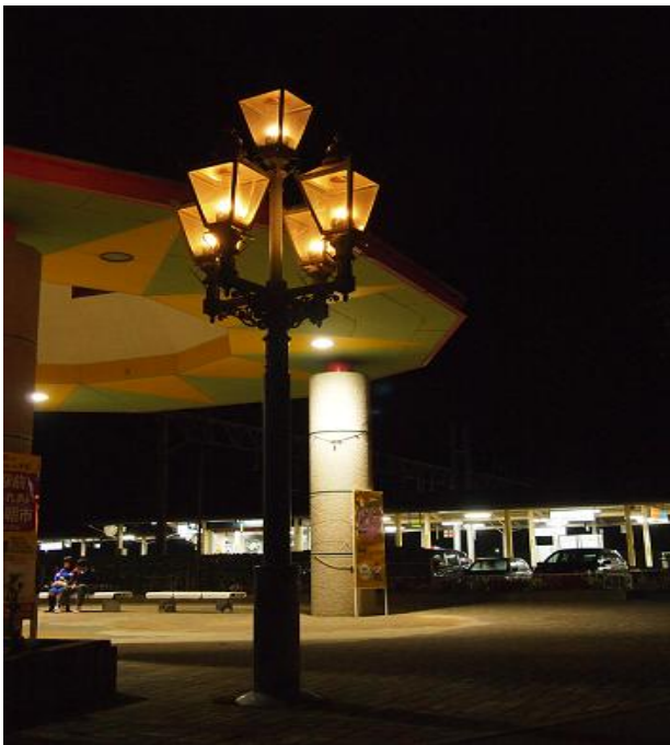
駅に向かって左側