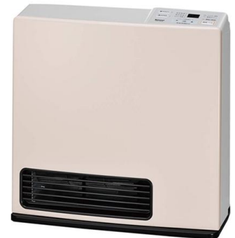
木造 11畳、コンクリート造 15畳