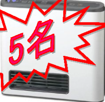
木造11畳、コンクリート造15畳用