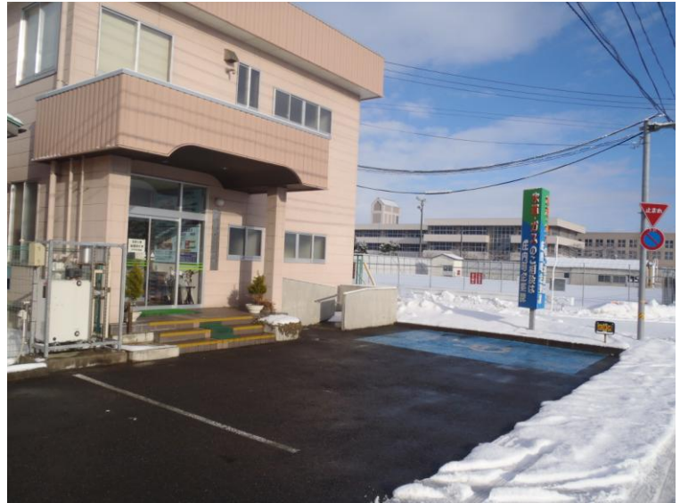
企業課庁舎前のロードヒーティングの様子