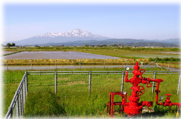
◎東北地方の都市ガス料金比較

※ 料金改定の仕組み上、新料金の原料費調整額は、ガス原料価格により近い形で増減します。