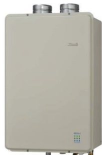
リンナイ製 屋内FF型 ガスふろ給湯器