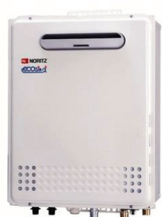
ノーリツ製 屋外設置型 ガスふろ給湯器