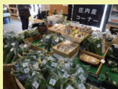
町内2か所の産直には、新鮮な野菜がズラリ

山形県の日本海側、庄内地方のほぼ中心に位置し、山にも川にもすぐに足を運べる庄内町。庄内平野の中央部から月山まで、南北に細長い形をしていて、隣接する都市のベッドタウンとして発展する市街地エリアと、自然豊かな中山間エリアに分かれています。