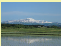
壺峰・月山の麓のまち